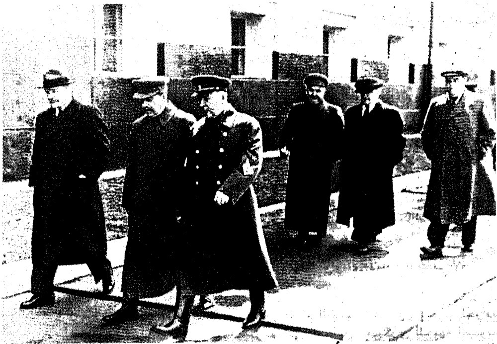
أثناء الحرب: ستالين محاطاً بالمارشال فوروشيلوف عن يساره ومولوتوف وزير الخارجية عن يمينه.